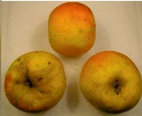
2 vues Jean-claude